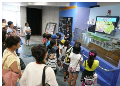
首都圏外郭放水路「龍Q館」