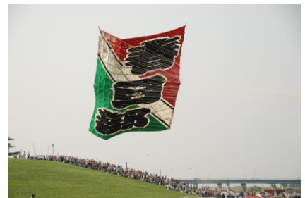
春日部市 大風あげ祭り

本リリースに関するお問合せ 経営戦略部 広報担当 TEL:03-3622-6215 (のざわ よこた 野澤・横田)