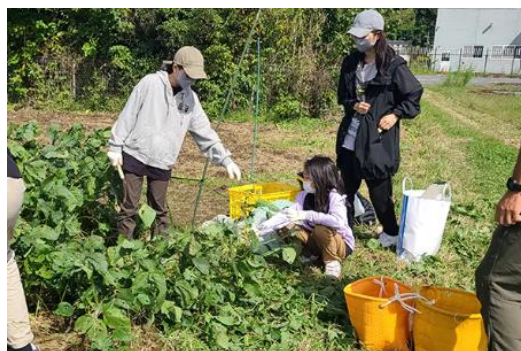
本取り組みの様子

ジャパン・ツーリズム・アワードとは、「旅のチカラ」の再生と持続可能性の確保につながる組織・企業・団体・個人の取り組みを参考となる事例として表彰し、ツーリズム EXPO ジャパンとの連携により、優れた受賞取り組みをモデルケースとして広く世の中に知らしめ、さらなるツーリズムの発展に貢献していくことを目的としているアワードです。