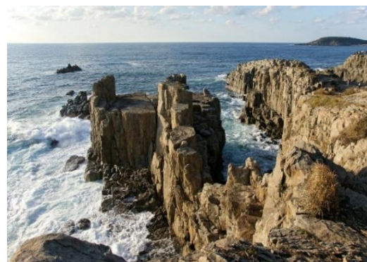
【東尋坊 三段岩・雄島】