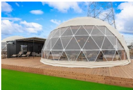
△ アドベンチャー・ドーム