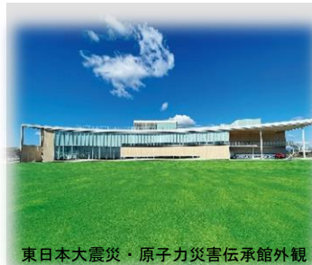
東日本大震災・原子力災害伝承館外観